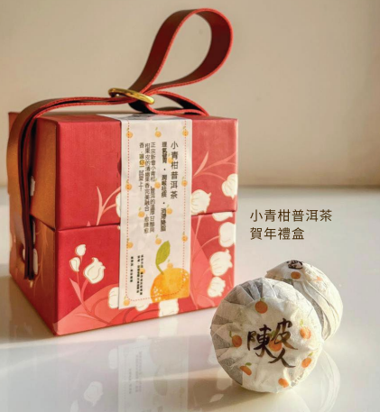
小青柑普洱茶 賀年禮盒