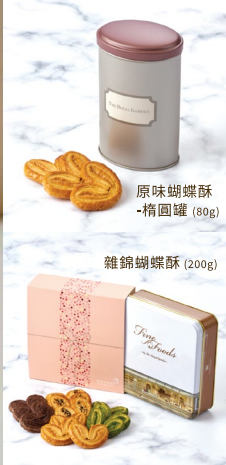
原味蝴蝶酥 - 橢圓罐 (80g)